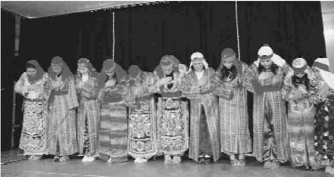
Darmstadt Cemevi Semah Ekibi

Cemevi kampanyamızın büyük başarısına, AB raporunda bu talebe yer verilmesine rağmen, AKP iktidarı bu talebimizi görmezden gelmeye devam ediyor. AKP iktidarı bu talebimizi görmezden geldiği gibi, Avrupa İnsan Hakları Mahkemesi'nde (AİHM) süren zorunlu din dersi'ne