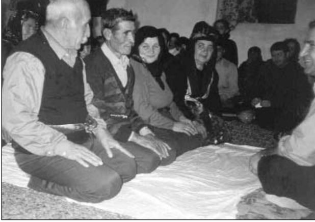
Fotoğrafların tümü, Ocak ayı içinde Dertli Divani Baba'nın Nurhak'ta yürüttüğü Görgü Cemindedir.

Getirdikleri yiyecekler ve dem şişesi ellerinde olmak üzere de dâr’a durulabilir. Duayı aldıktan sonra yiyecekleri bu işle görevli hizmet sahibine verirler. Birçok yerde genellikle böyle yapılmaktadır. Duayı alan eşler diz üzerine gelerek meydana niyaz ederler. Böylece hem “ Âdem’e ” secde edenlere karışmış olurlar, hem de tüm ceme katılmış olanlarla niyazlaşmış, görüşmüş olurlar. Ayrıca dede ile veya cemde